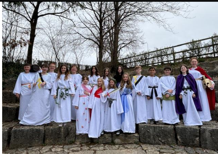
Die SchauspielerInnen mit ihren selber hergestellten Kostümen