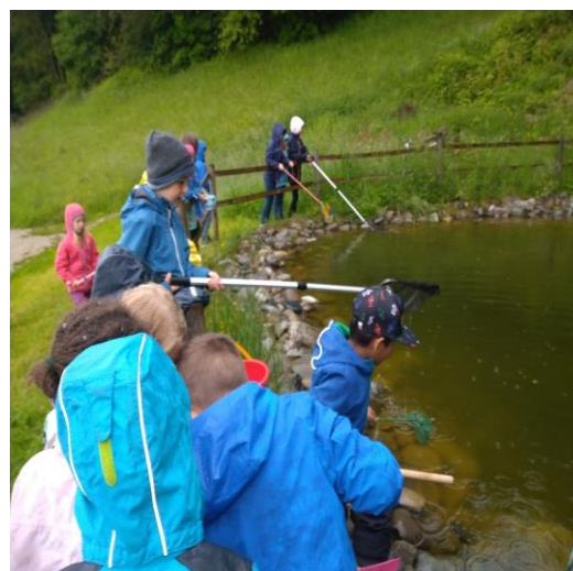
Lehrpersonen 1./2. Klasse